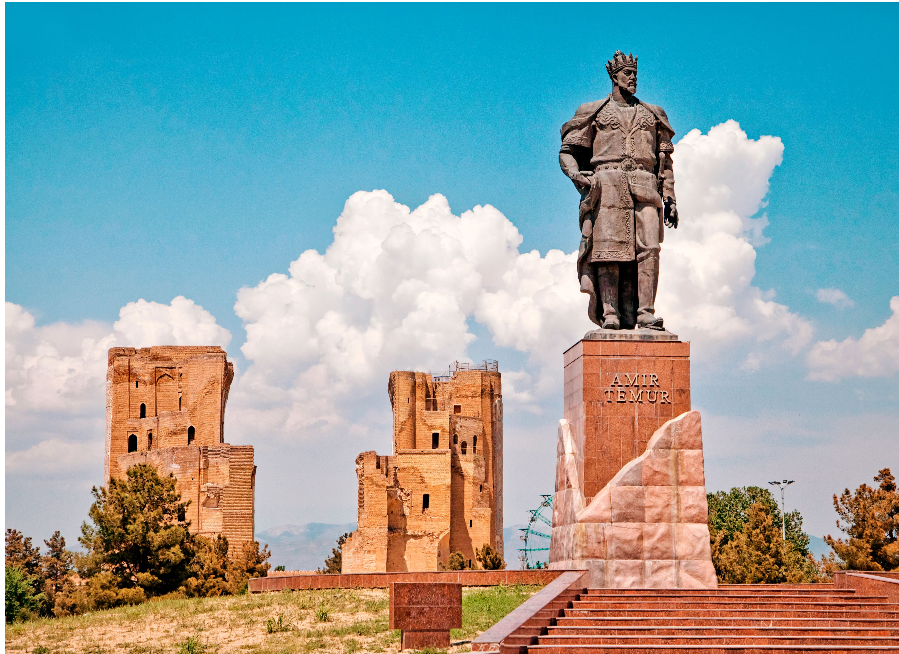
Statua di Tamerlano e Rovine del Palazzo Ak-Saray a Shahrisabz 📍